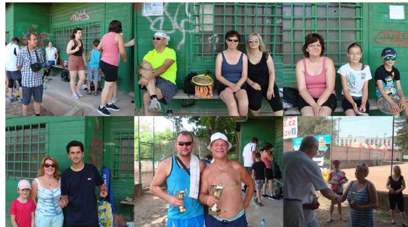
Pracovnice na tenisovém turnaji