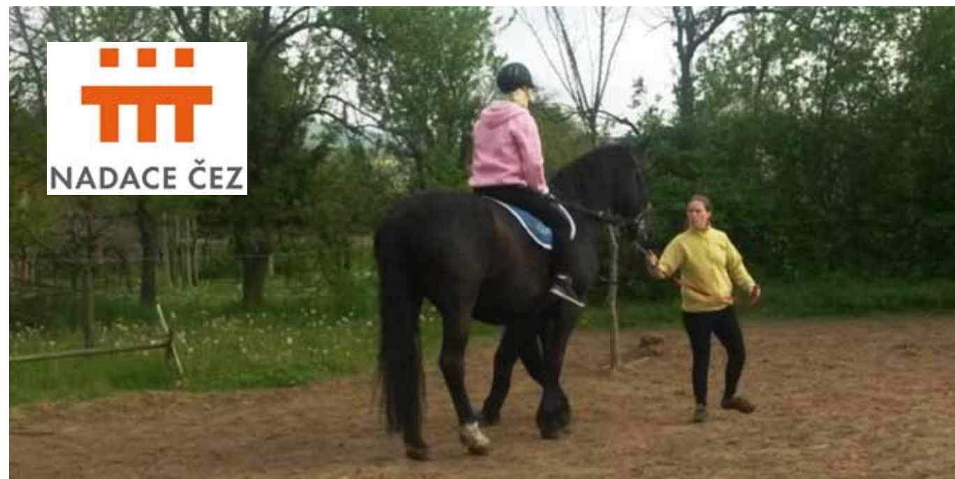
Na výletě na ranči