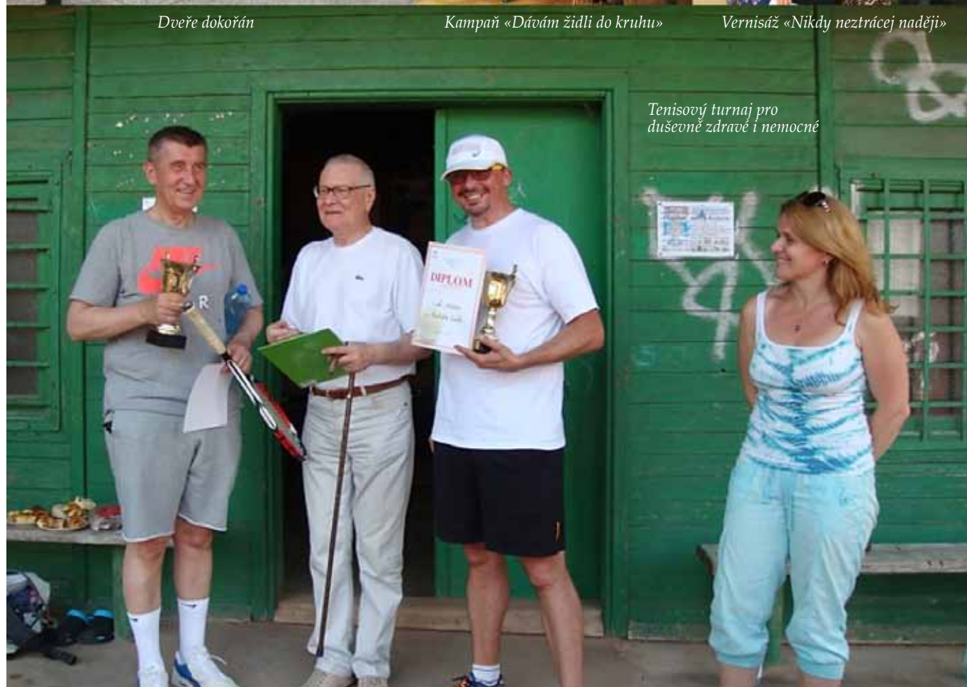
Tenisový turnaj pro duševně zdravé i nemocné