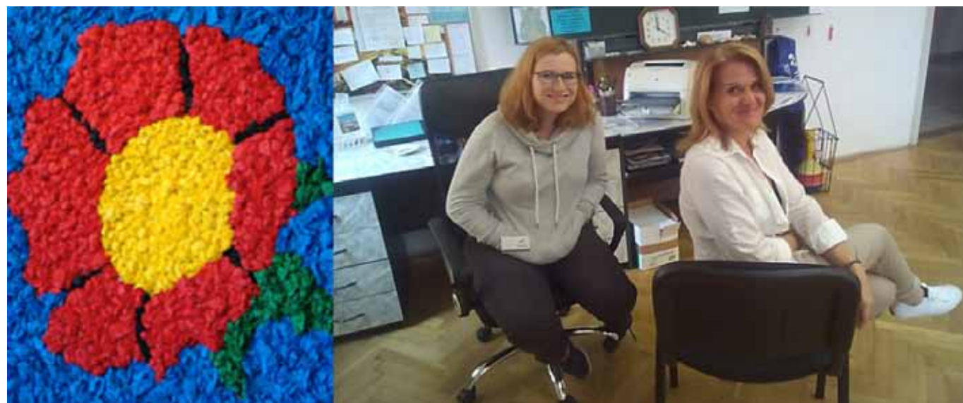
Vedoucí DS s dobrovolnicí

Také touto cestou bychom chtěli všem našim dobrovolníkům moc poděkovat za jejich ochotu, trpělivost a čas, který vynakládají na tak záslužnou činnost. Děkujeme Vám! Bez Vás by to nešlo!